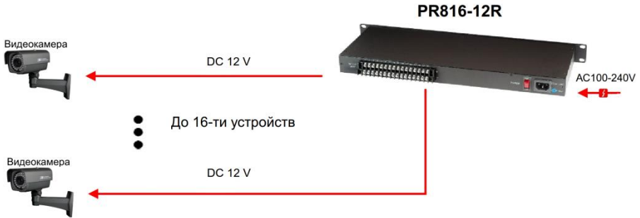
Рис.3 Схема подключения PR816-12R