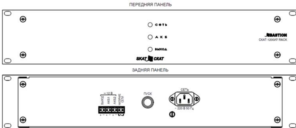
Рисунок 1. Внешний вид источника.

Подключение источника к сетевому напряжению осуществляется через входной разъем СЕТЬ и шнур сетевого питания, входящий в комплект поставки.