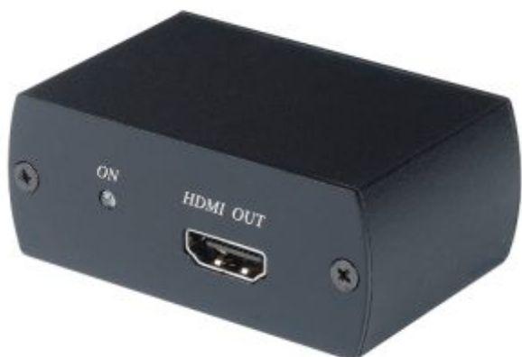
Рис.1 Внешний вид HR01