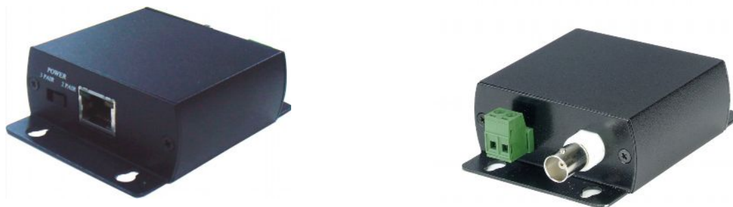
Рис.1 Внешний вид