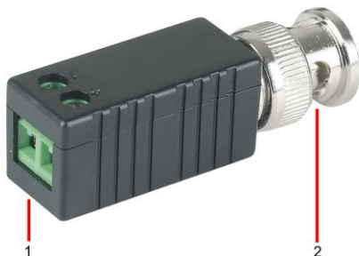
Рис. 2 Приёмопередатчик ТТР111HD, разъемы