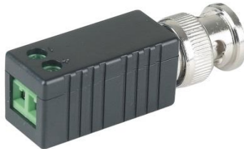
Рис.1 Приёмопередатчик ТТР111HD